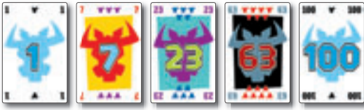
100 Hornochsenkarten mit Zahlen von 1 bis 100