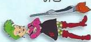
Schubia Wanzhaar (Ludmilla Punaise)