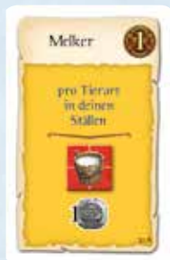
Karte 10 A: Diese Karte trifft auch auf Schweine und Pferde zu.

Durch die neuen Warensorten und Aktionsfelder werden einige Ausbildungskarten in ihrer Funktion erweitert. 3 der 190 Karten können in bestimmten Situationen nicht mehr verwendet werden. Maßgeblich ist die Abbildung und der Text auf der Karte, auch wenn die Beschreibung im Anhang eventuell nur die alten Warensorten und Aktionsfelder aufzählt und nicht die neuen.