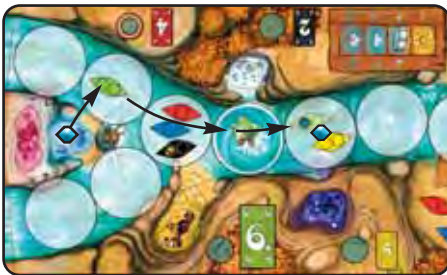
Abb. 4e: Gina GRÜN hat die „6“ gespielt. Mit ihrem Zweier-Kanu lädt sie zunächst (für 2 Paddelpunkte) einen Edelstein auf. Es bleiben ihr noch 4 Paddelpunkte, um den Strudel zu überqueren. Hier kann Gina Gunnar bestehlen.

Befindet sich der Strudel direkt an der Flussgabelung (neben der gelben Fundstelle), darf man Kanus, deren Bewegung dort endet, nach Wunsch im linken oder rechten Flussarm abstellen (vgl. Abb.5).