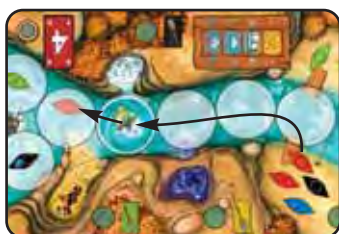
Abb. 4a: Resi ROT hat eine „4“ gespielt. Sie zieht ihr Kanu flussabwärts und landet genau auf dem Strudel. Dort darf es nicht stehen. Deshalb muss sie das Kanu ein Feld (weiter) flussabwärts ziehen.

Endet die Bewegung eines Kanus im Strudel, wird es sofort ein Feld weiter flussabwärts gezogen und dort abgestellt (vgl. Abb. 4a)