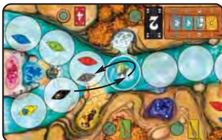
Abb. 4b: Siggı SCHWARZ hat eine „2“ gespielt. Sein Kanu landet somit auf dem Strudel. Dort darf es nicht stehen. Siggı muss sein Kanu ein Feld (zurück) flussabwärts ziehen.

Endet die Bewegung eines Kanus auf dem Strudelfeld, wird es vom Strudel ein Feld zurück flussabwärts gespült und dort abgestellt (vgl. Abb. 4b + 4c). Es darf dort keine Kanus bestehen.