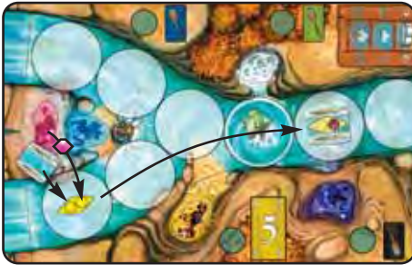
Abb. 9: Gunnar GELB hat eine „5“ gespielt. Da eines seiner Kanus an der roten Fundstelle steht und sich dort der Flussgeist EILIGER ELCH befindet, nimmt er diesen mit. Dadurch nutzt er nun 7 Paddelpunkte für die Bewegung seines „Elch-Kanus“. Er belädt sein Kanu mit einem roten Edelstein und zieht über den Strudel hinweg.

Es ist nicht möglich, den Elch einem anderen Spieler wegzunehmen.