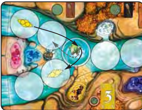
Abb. 5: Gunnar zieht mit einer „3“ aus dem rechten Flussarm heraus. Den Strudel an der Flussgabelung kann er jedoch damit nicht überwinden. Er muss sein Kanu also ein Feld flussabwärts abstellen und wählt hierfür den linken Flussarm.

Befindet sich der Strudel direkt an der Flussgabelung (neben der gelben Fundstelle), darf man Kanus, deren Bewegung dort endet, nach Wunsch im linken oder rechten Flussarm abstellen (vgl. Abb.5).