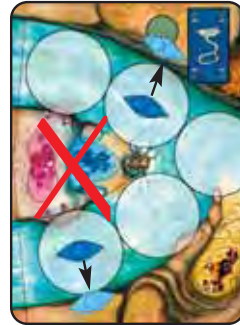
Abb. 7a: Die Landzunge ist für Kanus tabu. Biggi BLAU muss ihre Kanus ans seitliche Ufer ziehen.

Die Landzunge, auf der sich die blaue und rote Fundstelle befinden, darf dabei nicht genutzt werden (vgl. Abb. 7a).