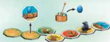
Fig. 2: David decides to turn over the next face down yard tile. As it is blue, he now has to steal one blue egg from the nest.

This means that you are never allowed to jump over a selected colour. After you have moved your Gulo, your left hand neighbour has his turn.