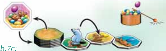
Abb.7c: EIERALARM beim Versuch, das lila Ei aus dem Nest zu holen: Klein-Gulo wird wieder verdeckt unter den Stapel gelegt und der Vielfraß wird um ein Plättchen rückwärts gezogen.