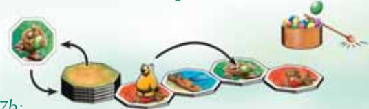
Abb.7b: EIERALARM beim aufgedeckten Stapelplättchen: Das Stapelplättchen wird verdeckt zurück unter den Stapel gelegt und der Vielfraß wandert rückwärts auf das nächste Plättchen dieser Farbe.