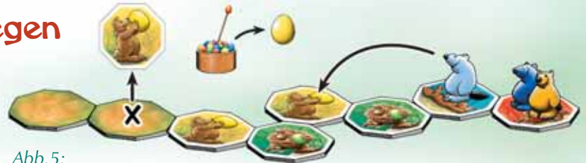
Abb.5: Jetzt ist Philip am Zug. Er beschließt, das nächste verdeckte Plättchen (X) aufzudecken. Es handelt sich um ein gelbes Plättchen. Nachdem er ein gelbes Ei aus dem Nest genommen hat, darf er nicht auf das soeben aufgedeckte, sondern nur auf das nächste gelbe Wegplättchen ziehen.

Wenn es dir gelungen ist, ein Ei aus dem Nest zu stibitzen, ohne EIER-ALARM auszulösen, läuft dein Vielfraß vorwärts bis auf das nächste offene Plättchen dieser Farbe (vgl. Abb. 5). Du darfst niemals ein Plättchen der ausgesuchten Eierfarbe überspringen! Wenn du deinen Vielfraß bewegt hast, ist dein linker Nachbar am Zug.