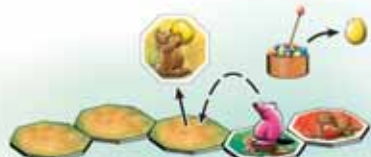
Fig. 4: There are only face down yard tiles in front of Clara's Gulo. As such, she has to turn over the first yard tile in front of her Gulo. It happens to be a yellow one and therefore she steals a yellow egg from the nest.

Illustr. 3: il y a beaucoup de bouts de chemin, faces visibles, devant le glouton de Vanessa. Elle peut retourner le bout de chemin suivant (X). Mais elle ne le fait pas et décide de prendre un œuf rouge pour pouvoir faire avancer son glouton aussi loin que possible (voir chapitre 2: le déplacement du glouton).