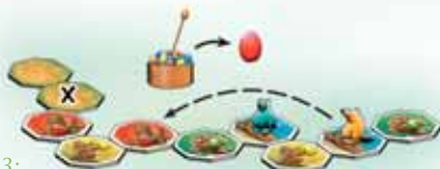
Fig. 3: There are open yard tiles in front of Matilda's Gulo. She can turn over the next face down yard tile (x). However, she decides not to turn over the next face down tile. She prefers to steal a red egg, since this will allow her Gulo to move the furthest (see: Chap. 2: Moving your Gulo).

Illustr. 2: David décide de retourner le bout de chemin suivant qui se trouve encore face cachée sur la table. Comme il est bleu, il doit piocher un œuf bleu dans le nid d'oiseau.