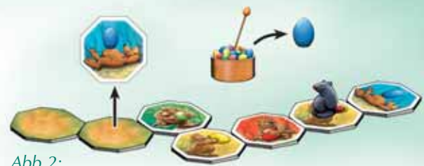
Abb.2: David beschließt, das nächste verdeckte Plättchen aufzudecken. Weil es blau ist, musst er ein blaues Ei aus dem Nest holen.