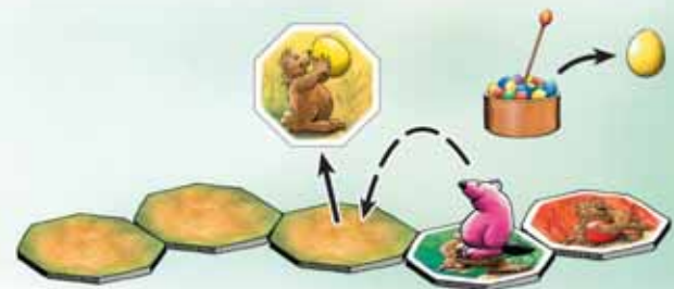
Abb.4: Vor Danielas Vielfraß liegen nur verdeckte Wegplättchen. Sie musst deshalb das erste Wegplättchen vor ihrem Vielfraß aufdecken. Weil dieses gelb ist, holt sie anschließend ein gelbes Ei aus dem Nest.