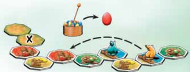
Abb.3: Vor Verenas Vielfraß liegen Wegplättchen offen aus. Sie darf das nächste verdeckte Plättchen (X) aufdecken. Sie verzichtet aber darauf und beschließt ein rotes Ei zu nehmen, weil sie dann ihren Vielfraß am weitesten vorwärts bewegen darf (siehe Kapitel 2).