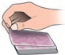
Aufdecken einer Karte

Seite nach vorne) von sich weg umgedreht. Je schneller die Bewegung, desto schneller sieht man auch selbst die offene Karte.