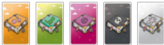
Stapel mit den Hexenbuch-Karten