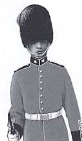
Illustration: Christian Dekelver Design: Christian Dekelver/ Ravensburger

Inhalt: 1 Buchstaben-Drehscheibe 1 Spielblock 1 Spielanleitung