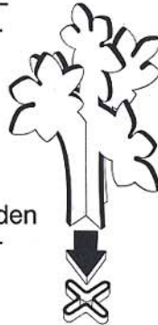
Abb. 1 b

Der jüngste Spieler fängt an. Er nimmt sich aus seinem Blättervorrat ein beliebiges Blatt, holt tief Luft und steckt das Blatt geschickt in die Baumkrone. Die Schlitzlöcher in den Blättern müssen dabei ineinandergreifen (vgl. Abb. 2). Selbstverständlich darf der Baum dabei nicht festgehalten werden.